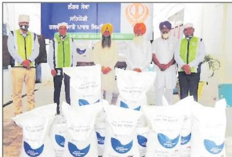
ਤਲਵੰਡੀ ਸਾਬੋ ਤਾਪ ਘਰ ਬਣਾਵਾਲੀ (ਮਾਨਸਾ) ਦੇ ਅਧਿਕਾਰੀ ਤਖ਼ਤ ਸ਼੍ਰੀ ਦਮਦਮਾ ਤਲਵੰਡੀ ਸਾਬੋ ਦੇ ਸੇਵਾਦਾਰਾਂ ਨੂੰ ਲੰਗਰ ਲਈ ਰਾਸ਼ਨ ਸੌਪਣ ਮੌਕੇ।