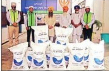
तख्त श्री दमदमा साहिब रके सेवादारां को जरूरतमंद लोगों के लिए लंगर सेवा का सामान देते टीपीसीएल के अधिकारी।