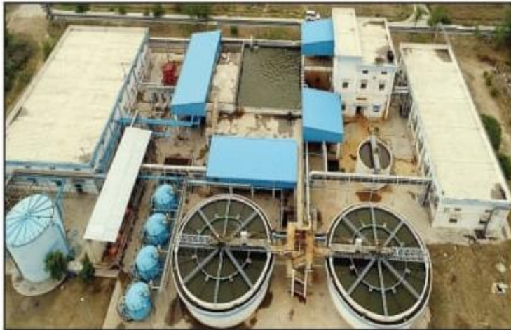
ਪਾਵਰ ਪਲਾਂਟ ਦਾ ਦ੍ਰਿਸ਼।