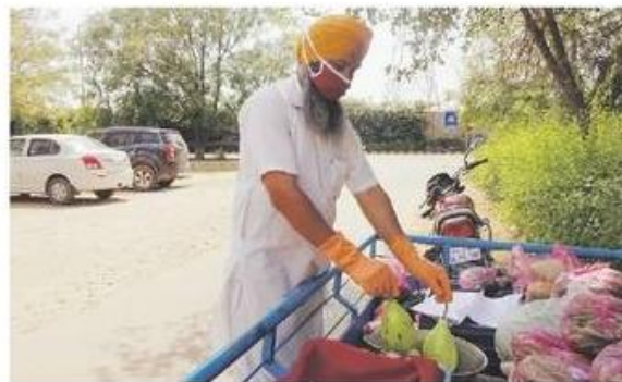
ताजा सब्जियां लेकर पहुंचा किसान।

कोविड-19 महामारी और राष्ट्रव्यापी लॉकडाउन के चलते देश की समग्र अर्थव्यवस्था को भारी नुकसान पहुंचा है और छोटे पैमाने के किसान इससे सबसे अधिक प्रभावित हुए हैं। आपूर्ति श्रृंखला के विघटन मांग और आपूर्ति पक्ष में उतार-चढ़ाव के साथ किसान अपनी फसल बेचने के लिए ग्राहक एवं बाजार की तलाश कर रहे हैं। इन किसानों की स्थिर आय सुनिश्चित करने के लिए तलवंडी साबो पॉवर लिमिटेड ने एक अनूठी पहल स्वाद स्ट्रेंथ एंड वेलनेस ऐट यूआर डोरस्टैप्स की शुरुआत की है। स्वाद के माध्यम से टीएसपीएल