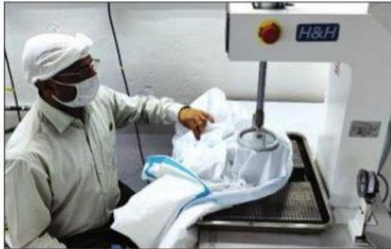
ਮਾਨਸਾ : ਵੇਦਾਂਤਾ ਦੇ ਗੁਰੂਗ੍ਰਾਮ ਪ੍ਰੋਜੈਕਟ 'ਚ ਘੀਧੀਈ ਕਿੱਟ ਬਣਾਉਣ ਦਾ ਹੋਇਆ ਇੱਕ ਕਰਮਚਾਰੀ।

ਵੇਦਾਂਤਾ ਵੱਲੋਂ ਟੈਕਸਟਾਈਲ ਮੰਤਰਾਲੇ ਦੇ ਸਹਿਯੋਗ ਨਾਲ ਮਸ਼ੀਨਾਂ ਦੀ ਦਰਾਮਦ ਕਰਕੇ ਆਪਣੇ ਗੁਰੂਗ੍ਰਾਮ ਪ੍ਰੋਜੈਕਟ 'ਚ ਘੀਧੀਈ ਕਿੱਟਾਂ ਦਾ ਉਤਪਾਦਨ ਸ਼ੁਰੂ ਕੀਤਾ ਗਿਆ ਹੈ। ਕੰਪਨੀ ਮੁਢਲੇ ਪੜਾਅ 'ਚ 15,000 ਘੀਧੀਈ ਕਿੱਟਾਂ ਤਿਆਰ ਕਰ ਚੁੱਕੀ ਹੈ। ਕੰਪਨੀ ਦੇ ਇੱਕ ਬੁਲਾਰੇ ਨੇ ਦੱਸਿਆ ਕਿ ਕੋਵਿਡ 19 ਦੇ ਸੰਕਟ ਦੌਰਾਨ ਫਰੰਟ ਲਾਈਨ ਤੇ ਕੰਮ ਕਰ ਰਹੇ ਹੈਲਥਕੇਅਰ ਵਰਕਰਾਂ ਅਤੇ ਡਾਕਟਰਾਂ ਦੀ ਸੁਰੱਖਿਆ ਲਈ ਫਿਕਰਮੰਦ ਅਤੇ ਉਨ੍ਹਾਂ ਦੀ ਜ਼ਿੰਦਗੀ ਮਹਿਫੂਜ਼ ਕਰਨ ਦੇ ਮਕਸਦ ਨਾਲ, ਵੇਦਾਂਤਾ ਲਿਮਟਿਡ, ਜੋ ਵਿਸ਼ਵ ਦੀ ਮੋਹਰੀ ਤੇਲ, ਗੈਸ ਅਤੇ ਮੈਟਲਜ਼ ਕੰਪਨੀ ਹੈ, ਨੇ ਗੁਰੂਗ੍ਰਾਮ ਵਿੱਚ ਪਰਸਨਲ ਪ੍ਰੋਟੈਕਟਿਵ ਉਪਕਰਣ (ਪੀਪੀਈਜ਼) ਦੇ ਵਿਆਪਕ ਉਤਪਾਦਨ ਵੱਲ ਪਹਿਲਕਦਮੀ ਸ਼ੁਰੂ ਕਰ ਦਿੱਤੀ ਹੈ। ਉਨ੍ਹਾਂ ਦੱਸਿਆ ਕਿ ਕੰਪਨੀ ਨੇ ਹਾਲ ਹੀ ਵਿੱਚ ਟੈਕਸਟਾਈਲ ਮੰਤਰਾਲੇ ਦੇ