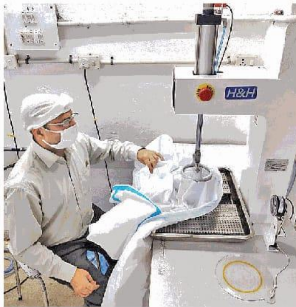
ਸਿਹਤ ਕਰਮੀਆਂ ਦੀ ਸੁਰੱਖਿਆ ਲਈ ਕਿੱਟਾਂ ਤਿਆਰ ਕਰਦੇ ਹੋਏ ਵੇਦਾਂਤਾ ਦੇ ਕਰਮਚਾਰੀ।

ਦੇਸ਼ ਭਰ ਵਿੱਚ ਚੱਲ ਰਹੀ ਕੋਰੋਨਾ ਮਹਾਮਾਰੀ ਦੌਰਾਨ ਮੁੱਢਲੀ ਕਤਾਰ ਵਿੱਚ ਸੇਵਾ ਕਰ ਰਹੇ ਸਿਹਤ ਕਰਮੀਆਂ ਦੇ ਸਹਿਯੋਗ ਲਈ ਦੁਨੀਆਂ ਦੀ ਮੁੱਖ ਤੇਲ, ਗੈਸ ਅਤੇ ਧਾਤੂ ਉਤਪਾਦਨ ਕੰਪਨੀ ਵੇਦਾਂਤਾ ਲਿਮਿਟਿਡ ਨੇ ਵੱਡੇ ਪੈਮਾਨੇ ਤੇ ਵਿਅਕਤੀਗਤ ਸੁਰੱਖਿਆ ਦੇ ਲਈ ਪੀਪੀਈ ਕਿੱਟਾਂ ਦਾ ਉਤਪਾਦਨ ਕੀਤਾ ਹੈ। ਕੰਪਨੀ ਨੇ ਕੇਂਦਰੀ ਕੱਪੜਾ ਭੰਡਾਰ ਦੇ ਸਹਿਯੋਗ ਨਾਲ 23 ਪੀਪੀਈ ਮਸ਼ੀਨਾਂ ਲਾਈਆਂ ਹਨ ਅਤੇ ਕੱਪੜਾ ਵਪਾਰੀਆਂ ਨਾਲ ਮਿਲ ਕੇ 5 ਹਜ਼ਾਰ ਤੋਂ ਜ਼ਿਆਦਾ ਪੀਪੀਈ ਕਿੱਟਾਂ ਦਾ ਉਤਪਾਦਨ ਕੀਤਾ ਜਾ ਰਿਹਾ ਹੈ। ਇਸ ਸਬੰਧੀ ਜਾਣਕਾਰੀ ਦਿੰਦਿਆਂ ਵੇਦਾਂਤਾ ਦੇ ਪ੍ਰਧਾਨ ਅਨਿਲ ਔਗਰਵਾਲ ਨੇ ਦੱਸਿਆ ਕਿ ਭਾਰਤ ਵਿੱਚ ਕੋਵਿਡ-19 ਦੇ ਪ੍ਰਭਾਵ ਨਾਲ ਲੜਨ ਲਈ ਵਿਆਪਕ ਤੌਰ 'ਤੇ ਇਕੱਜੁੱਟਤਾ ਦਿਖਾਈ ਹੈ। ਉਨ੍ਹਾਂ ਕਿਹਾ ਕਿ ਪੀਪੀਈ ਕਿੱਟਾਂ ਸਿਹਤ ਕਰਮੀਆਂ ਦੇ ਲਈ ਸੁਰੱਖਿਆ ਦਾ ਮਹੱਤਵਪੂਰਨ ਸਾਧਨ ਹੈ ਅਤੇ ਹੋਰਨਾਂ ਦੇਸ਼ਾਂ ਦੀ ਤਰ੍ਹਾਂ ਭਾਰਤ 'ਚ ਵੀ ਸਿਹਤ ਕਰਮੀਆਂ ਦੀ ਸੁਰੱਖਿਆ ਨੂੰ ਮੁੱਖ ਪੀਪੀਈ ਕਿੱਟਾਂ ਉਪਲੱਬਧ ਕਰਵਾਉਣ ਦੇ ਲਈ ਕੰਪਨੀ ਵੱਲੋਂ ਯਤਨ ਕੀਤੇ ਜਾ ਰਹੇ ਹਨ। ਜਿਸ 'ਚ ਸਹਿਯੋਗ ਦਿੰਦਿਆਂ ਵੇਦਾਂਤਾ ਨੇ ਹੁਣ ਤੱਕ 15 ਹਜ਼ਾਰ ਪੀਪੀਈ ਕਿੱਟਾਂ ਦਾ