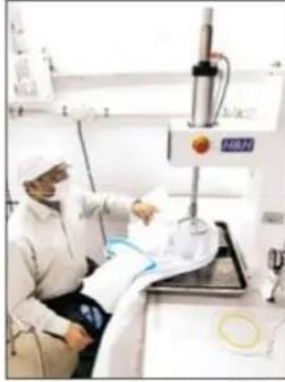
वस्त्र मंत्रालय द्वारा प्रमाणित एवं वेदांता द्वारा गुरुग्राम में आयातित पीपीई मशीनों द्वारा उत्पादन कार्य जारी।

बटिंडा, 1 मई (श्रीवास्तव) : कोरोना कर्मयोद्धाओं के रूप में सेवा देने वाले चिकित्सा कर्मियों एवं चिकित्सकों के सहयोग के लिए विश्व की प्रमुख तेल, गैस एवं धातु उत्पादन कंपनी वेदांता लिमिटेड गुरुग्राम में बड़े पैमाने पर व्यक्तिगत सुरक्षा उपकरण के रूप में पीपीई का उत्पादन किया जा रहा है। कंपनी ने हाल ही में केन्द्रीय वस्त्र मंत्रालय के सहयोग से 23 पीपीई मशीनों का आयात किया है, और अधिकृत परिधान निमाताओं के साथ मिलकर 5000 से अधिक पीपीई प्रति उत्पादन सुनिश्चित किया है। पीपीई चिकित्सा कर्मियों के लिए सुरक्षा का महत्वपूर्ण संसाधन है और अन्य देशों की तरह भारत में भी स्वास्थ्य