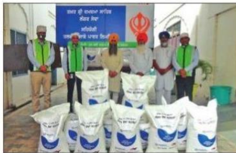
ਮਾਨਸਾ : ਤਖਤ ਸ੍ਰੀ ਦਮਦਮਾ ਸਾਹਿਬ ਦੇ ਅਹੁਦੇਦਾਰਾਂ ਨੂੰ ਰਾਸ਼ਨ ਸੌਂਪਦੇ ਹੋਏ ਵੇਦਾਂਤਾ ਅਧਿਕਾਰੀ।

ਦੌਰਾਨ ਟੀਐਸਪੀਐਲ ਆਪਣੇ ਇਲਾਕੇ ਦੇ ਨਾਗਰਿਕਾਂ ਦੀ ਸਹਾਇਤਾ ਲਈ ਵਚਨਬੱਧ ਹੈ। ਉਨ੍ਹਾਂ ਆਖਿਆ ਕਿ ਰੋਜੀ ਰੋਟੀ ਦੇ ਸੰਕਟ ਨਾਲ ਜੂਝ ਰਹੇ ਨਾਗਰਿਕਾਂ ਨੂੰ ਭੋਜਨ ਦੀ ਉਪਲੱਬਧਤਾ ਨੂੰ ਯਕੀਨੀ ਬਣਾਉਣਾ ਵੱਡੀ ਸਹਾਇਤਾ ਹੈ ਅਤੇ ਟੀਐਸਪੀਐਲ ਲਈ ਇਹ ਸੰਤੁਸ਼ਟੀ